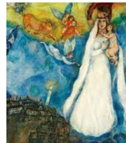
Marc Chagall: "La Madonna del Villaggio" 1942 olio su cartone - Madrid

Il quadro raffigura una Madonna imponente nelle sue dimensioni, maestosa nel suo abito bianco da sposa, eppure (nella vita c'è sempre un "eppure", grazie a Dio!) dal volto profondamente umano e dolcissimo con in braccio il Bambino Gesù. In fondo a sinistra il Villaggio, cioè tutto il nostro povero mondo, verde e buio. Ma la tenebra del Villaggio è illuminata da una candela e sovrastata dallo splendore della Madonna. È lei che protegge tutti gli abitanti di quel villaggio. È lei che porta la luce di chi salva, tant'è che il cielo è di un azzurro luminoso e pieno di speranza.