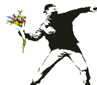
Banksy, The Flower Thrower